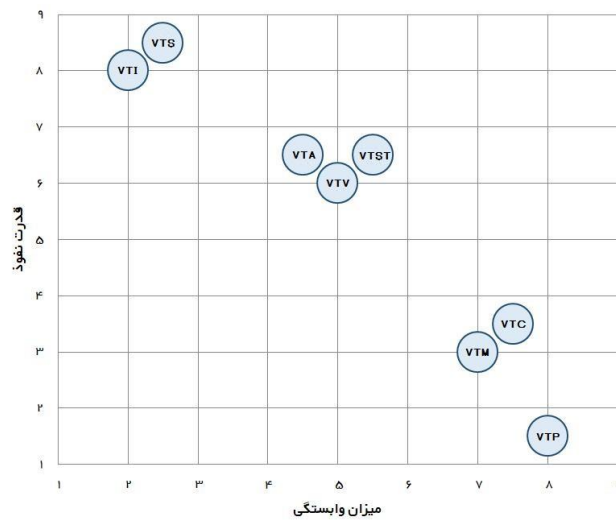
شکل ۲- نمودار قدرت نفوذ و میزان وابستگی (خروجی میک-مک)