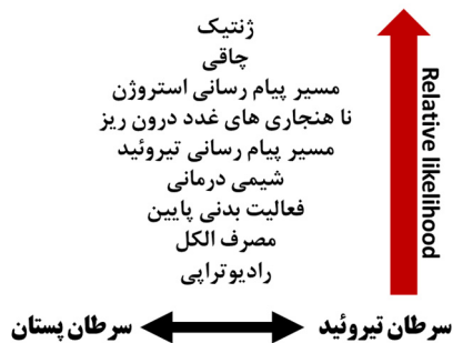
شکل ۲- مکانیسم‌های محتمل در ارتباط بین دو سرطان پستان و تیروئید (۲)