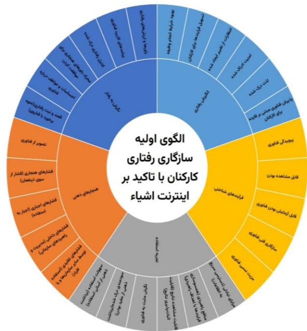
شکل ۱- مدل اولیه و پیشنهادی الگوی سازگاری رفتاری کارکنان

به آن در مدل نهایی اضافه شده است. از سویی دیگر هر کدام از این ابعاد دارای شاخص‌هایی هستند که در شکل شماره ۱ شاخص‌های پیشنهادی هر کدام از ابعاد ارائه شده است. به عنوان مثال برای بعد نگرش به رفتار شاخص‌هایی مانند باورها و ارزش‌های رفتاری، پیامدهای کاربرد فناوری، کنترل رفتاری درک شده، محرم کاربرد فناوری‌های هنجاری برای موافقت کردن، احساسات و عواطف درباره فناوری و قصد و نیت رفتاری (نحوه برخورد با فناوری) پیشنهاد شده است.