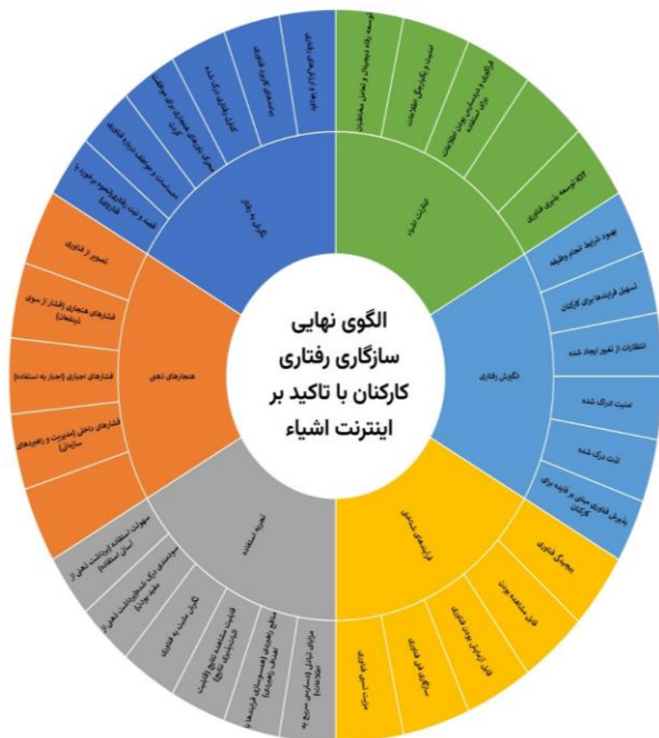
شکل ۱- مدل نهایی و پیشنهادی الگوی سازگاری رفتاری کارکنان

هستند. نتایج نشان می‌دهند که بعد انگیزش رفتاری با وزن ۱/۵۶۳ در رتبه اول از نظر میزان اهمیت در سازگاری رفتار کارکنان در انقلاب صنعتی چهارم با تأکید بر اینترنت اشیا قرار دارد. همچنین بعد فرایندهای شناختی با وزن ۱/۵۹۰ در رتبه دوم از نظر میزان اهمیت در سازگاری رفتار کارکنان در انقلاب صنعتی چهارم با تأکید بر اینترنت اشیا قرار دارد. همچنین بعد سازگاری رفتار کارکنان در انقلاب صنعتی چهارم با تأکید بر اینترنت اشیا قرار دارد. سایر ابعاد به ترتیب شامل بعد نگرش به رفتار با وزن ۱/۳۴۲، بعد تجربه استفاده با وزن ۰/۷۰۷ و بعد هنجارهای ذهنی با وزن ۰/۶۰۲ در رتبه‌های بعدی (چهارم تا ششم) از نظر میزان اهمیت در سازگاری رفتار کارکنان در انقلاب صنعتی چهارم با تأکید بر اینترنت اشیا قرار دارند. نتایج بدست آمده در این تحقیق مدلی ارائه می‌کند که سازگاری رفتاری کارکنان در انقلاب صنعتی چهارم با تأکید بر اینترنت اشیا را نشان می‌دهد. این الگو مشتمل بر ابعاد و شاخص‌هایی است که بر اساس آن می‌توان سازگاری رفتاری کارکنان را در عصر اینترنت اشیا در سازمان ارزیابی و پیش بینی کرد. در این خصوص