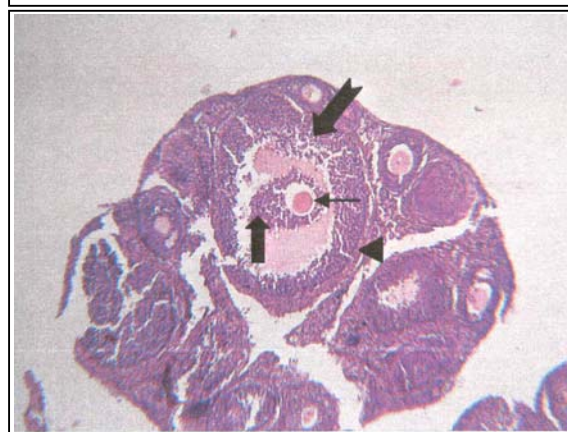
شکل شماره ۱- تصویر میکروسکوپ نوری مقطع تخمدان نرمال (بالا) و تخمدان موشی که عصاره الکلی Ruta دریافت نموده است (پایین). کوچک شدن تخمدان تیمار شده نسبت به تخمدان نرمال، بهم ریختگی لایه گرانولوزا، جدا شدن سلولهای تاجی شعاعی از گرانولوزا، کاهش قطر اووسیت در فولیکول گراآف غیرطبیعی (پایین) نسبت به فولیکول گراآف نرمال (بالا) واضح می‌باشد. لایه گرانولوزا (↑)، سلولهای تاجی شعاعی (▲)، اووسیت (↑) و فولیکول گراآف (▲). (بزرگنمایی ×۱۳۶)