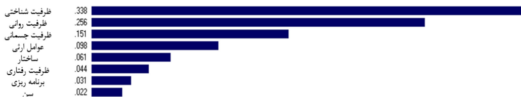
شکل ۳- تحلیل سلسله مراتبی مولفه های زمینه‌ای توسعه سواد بدنی دانش آموزان

دانشمندان و ذهنیت های خلاق جوان، دیدگاه جهانی، پایگاه وسیعی از دانش و آخرین تفکر در موضوعاتی مانند روابط اجتماعی، ارتباطات، هدایت مریبان، انسجام تیم، انگیزه و جو انگیزشی، تأثیرات مخاطب و اخلاق تشکیل شده است (۲۵). در این پژوهش اجتماعی شدن به عنوان یکی از شاخص های ظرفیت روانی در نظر گرفته شده است. دانش آموزان با اجتماعی شدن، بیشتر انگیزه پیدا می کنند تا توانایی های خود را پیدا کنند و در اینجاست که نیاز به سواد بدنی ضرورت می یابد. ظرفیت جسمانی یکی از دیگر فاکتورهای مهم در عوامل زمینه ای توسعه سواد بدنی است (۱۵). هر سه مورد اول تا سوم یعنی ظرفیت شناختی، ظرفیت روانی و ظرفیت جسمانی در واقع اهداف تربیت بدنی هستند. با رویکرد توسعه ای به این مولفه ها می توان شاهد رشد سواد بدنی در بین دانش آموزان باشیم. یکی دیگر از مولفه ها، مولفه ای شاخص ارثی بود که نتیجه آزمون تی مستقل نشان داد بین استان های برخوردار و کم برخوردار تفاوت