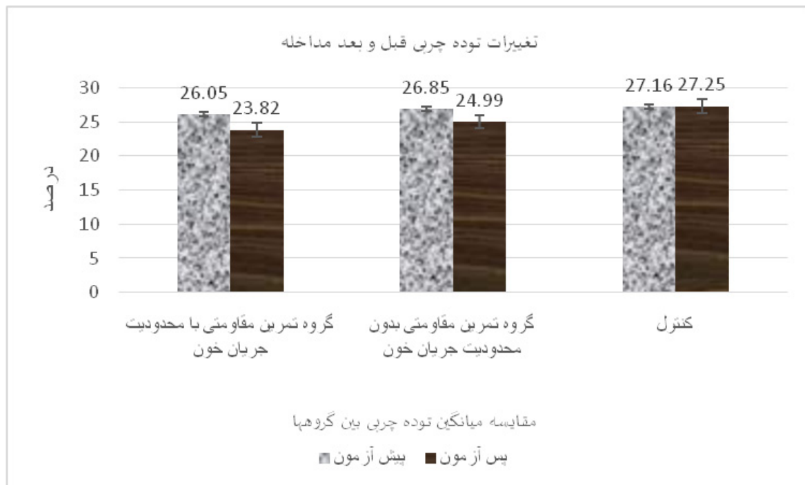
نمودار ۱- تغییرات توده چربی بین گروه‌ها:

نتایج نشان داد تمرین مقاومتی همراه با محدودیت