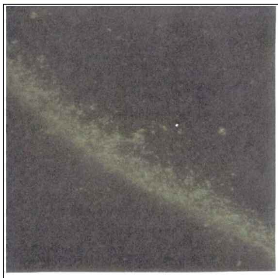
شکل شماره ۲ - آنتی‌بادی IgM مثبت کلامیدیا تراکوماتیس در زنان مبتلا به سرویسیت با روش MIF (بزرگنمایی \times 40 )

۱۳/۱٪ افراد مثبت گردیده است. تفاوت نتیجه بدست آمده از نظر آماری معنی‌دار می‌باشد ( P < 0/039 ) (جدول شماره ۲). در روش میکروایمونوفلئورسانس، با استفاده از میکروسکوپ ایمونوفلئورسانس، موارد مثبت آنتی‌بادی کلامیدیا تراکوماتیس به صورت نقاط سبز رنگ فلئورسانس شدند (شکل شماره ۱ و ۲).