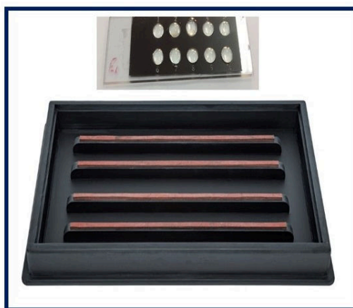
شکل ۱- در قسمت بالای تصویر، لام همراه قطرات نوتروفیل در چاهکها را نشان می‌دهد که پس از خشک شدن با اتانول فیکس می‌شوند. در قسمت پائین تصویر جار مرطوب نمایش داده شده که از آب برای ایجاد رطوبت پس از بسته شده استفاده می‌شود و در مرحله انکوبه نمودن نمونه‌ها روی چاهکها استفاده شد.

شده به خوبی همگن و یکنواخت شدند. مقدار ۲۵ میکرولیتر از نمونه‌های رقیق شده به همراه گروه کنترل منفی و مثبت به چاهکها اضافه شدند. لام‌های حاوی نمونه به مدت ۳۰ دقیقه در اتاقک مرطوب در دمای اتاق نگهداری شدند. سرم‌ها رقیق شده روی لام به آهستگی با بافر PBS به همراه ۰/۰۵ درصد دترژنت توئین ۲۰ (Tween20) از روی سطح لام شسته شده، سپس لام‌ها در جار حاوی PBS همراه با حرکت ۳ بار به مدت ۱۰ دقیقه شستشو داده شدند. مقدار ۲۵ میکرولیتر آنتی‌بادی کونژوگه با ماده فلورسنت FITC (human Anti-IgG Antibody-FIT, Avicenna, Iran) را به هر چاهک اضافه و به مدت ۳۰ دقیقه در اتاقک مرطوب و تاریک در دمای اتاق انکوبه شد. آنتی‌بادی کونژوگه روی لام به آهستگی با PBS از روی سطح لام شسته شده، سپس دوباره لام‌ها در جار حاوی PBS همراه با حرکت، ۳ بار به مدت ۱۰ دقیقه شستشو داده شدند (دور از نور). لام‌ها به صورت افقی در جایی دور از جریان هوا و نور قرار داده شدند تا رطوبت سطح لام خشک شد (از آنجائیکه رطوبت روی سطح لام نباید بطور کامل از بین برود، از کاغذ رطوبت‌گیر به منظور خشک نمودن اطراف چاهکها استفاده شد) سپس یک قطره بافر مونته (pH=9.2-9.3) روی هر چاهک ریخته و لامل روی آن قرار داده شد. با استفاده از میکروسکوپ فلورسانس شدت و نوع الگوی لام‌ها بررسی شدند. برای نمونه‌های مثبت این مراحل با استفاده از رقت‌های سریالی سرم (۲۰-۴۰-۸۰-۱۶۰) تا کسب نتیجه منفی