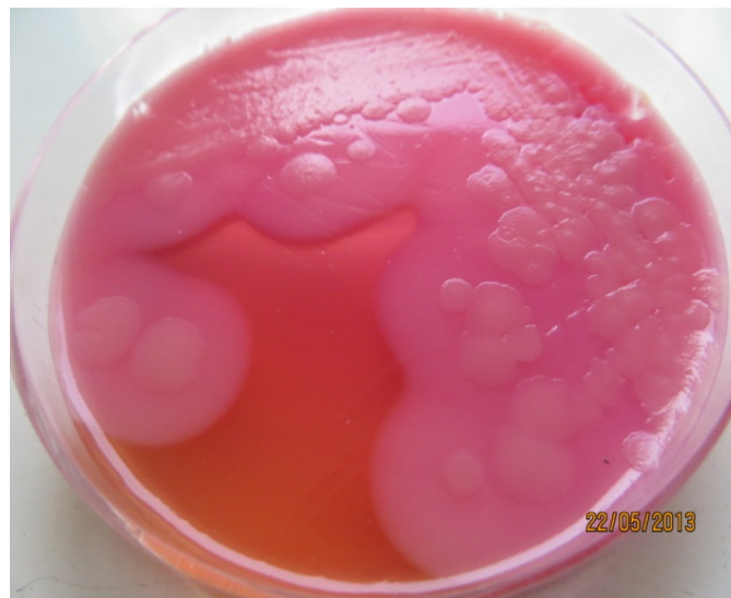
شکل ۱- کلنی‌های باسیلوس سرئوس بر روی محیط MYP آگار بعد از ۲۴ ساعت

از ۸ نوع سبزی برگ‌دار شامل شوید، تره، ترخون، جعفری، نعنا، گشنیز، قرمه سبزی و سبزی آش، از هر کدام ۱۰ نمونه تهیه شد. سپس به منظور جداسازی باسیلوس سرئوس، ابتدا ۵ گرم از نمونه را در ۴۵ میلی‌لیتر رینگر استریل ریخته و سپس سوپانسیون تهیه شده را به خوبی مخلوط کرده و از آن روی محیط کشت اختصاصی باسیلوس سرئوس (MYP) برده و به مدت ۲۴-۴۸ ساعت در ۳۷ درجه سانتی‌گراد گرما گذاری شدند. کلنی‌های بزرگ صورتی (عدم تخمیر مانیتول) با هاله‌ی رسوب دار (به دلیل تولید لستیناز) کلنی‌های مشکوک محسوب می‌شوند (شکل ۱). سپس برای جداسازی باکتری‌های این گروه از تست‌های