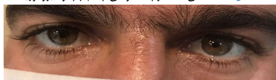
شکل ۲- بهبود مختصر پتوز چشم چپ و کاهش آنیزوکوریا