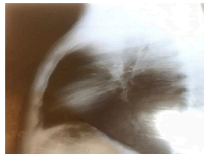
شکل ۴- در گرافی لنفادنوپاتی ناف ریه‌ها مشخص است