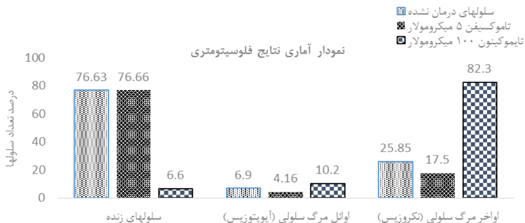
تصویر ۳- کاهش درصد سلول‌های زنده بعد از ۲۴ ساعت درمان با تایموکینون ۱۰۰ میکرومولار در مقایسه با سلول‌های تیمار نشده و تاموکسیفن ۵ میکرومولار. همچنین افزایش درصد سلول‌ها در اوائل مرگ سلولی و بطور معناداری در اواخر مرگ سلولی با نمونه تایموکینون دیده می‌شود.