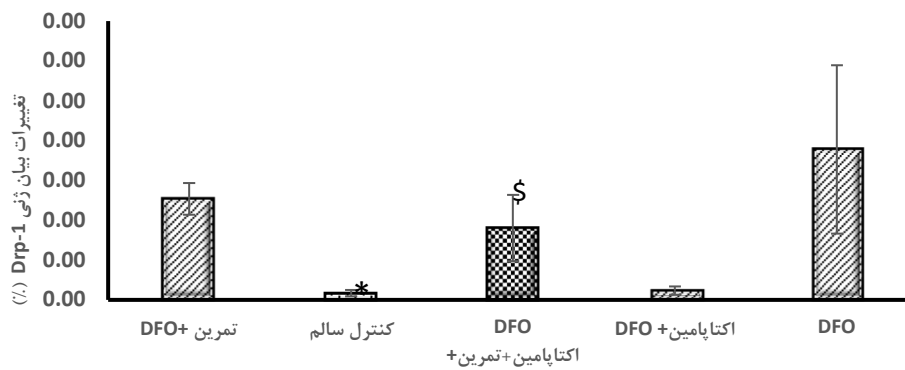
شکل ۱- میانگین \pm انحراف استاندارد تغییرات بیان ژن Drp-1 در پنج گروه. * نشانگر تفاوت معنادار گروه کنترل سالم با DFO می باشد. $ نشان دهنده تفاوت معنادار گروه DFO+اکتاپامین+تمرین با گروه DFO می باشد.