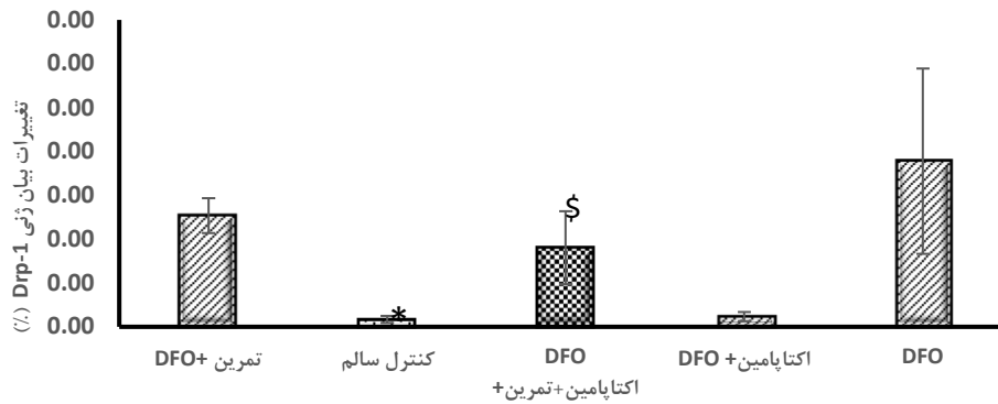
شکل ۱- میانگین \pm انحراف استاندارد تغییرات بیان ژن Drp-1 در پنج گروه. * نشانگر تفاوت معنادار گروه کنترل سالم با DFO می باشد. $ نشان دهنده تفاوت معنادار گروه DFO+اکتاپامین+تمرین با گروه DFO می باشد.