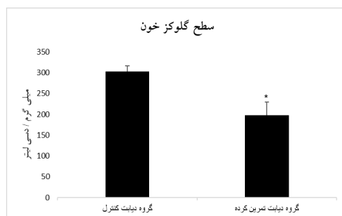
* اختلاف آماری معنی دار با گروه دیابت کنترل ( p \leq 0.001 ) شکل ۱- سطح گلوکز خون دو گروه در پس آزمون

نتایج آزمون t مستقل در مورد بررسی عامل مرتبط با شکافت میتوکندریایی در بافت بطن چپ رت‌ها نشان داد که بیان ژن Drp1 در حیوانات دیابتی تمرین کرده