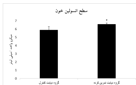
شکل ۲- سطح انسولین خون دو گروه در پس آزمون. * اختلاف آماری معنی‌دار با گروه دیابت کنترل ( p \leq 0.001 )