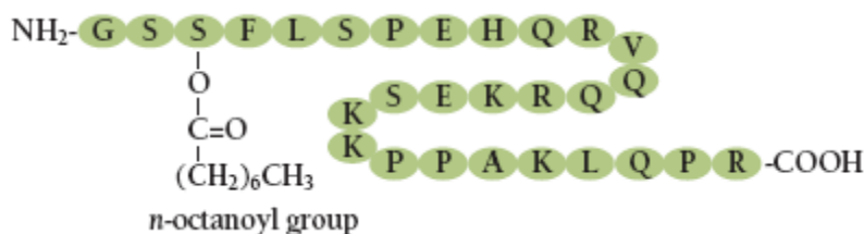
شکل ۱- ساختار گرلین انسانی. گرلین یک پپتید ۲۸- آمینو اسیدی است که در محل Ser 3 توسط n- اکتانویک اسید (n-octanoic acid) اصلاح شده است. این تصحیح برای فعال شدن گرلین ضروری است (۶)

اهمیت کنترل چاقی، اشتها، پیچیدگی های آن و دستیابی به دانش بیشتر، فن‌آوری و روش های تشخیصی مناسب، تلاش پژوهشگران را دوچندان ساخت، به صورتی که بافت چربی، عضله اسکلتی و کبد به عنوان اندام های درون ریز شناخته شده و بر نقش آن ها در متابولیسم مواد غذایی تأکید شده است. با کشف پپتیدهای ترشح شده مؤثر بر اشتها از دستگاه گوارش، نقش این هورمون ها در تعادل انرژی پر رنگ تر گردید و معده نیز مانند بافت چربی، عضله و کبد به عنوان یک اندام درون ریز مؤثر بر تعادل انرژی شناخته شد. در واقع هرچند نقش عوامل مرکزی در تنظیم تعادل انرژی از اهمیت زیادی برخوردار است، اما پژوهش های بسیاری نشان داده که پیام های محیطی به دست آمده از بافت های مختلف بدن ی بر کنترل هومئوستاز انرژی از جمله دریافت و هزینه آن تأثیر به سزایی دارند (۲).