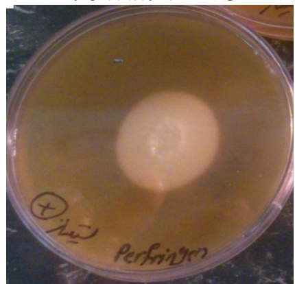
شکل ۲- کلستریدیوم پرفرنژنس لسیتیناز مثبت روی محیط Egg yolk agar

کلستریدیوم پرفرنژنس در سبزیجات خشک از نظر ژن آنروتوکسین ( cpe ) می‌باشد.