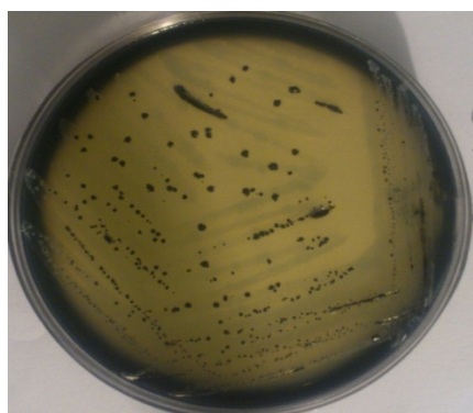
شکل ۱- کلنی‌های کلستریدیوم پرفرنژنس روی محیط SPS

پس از ۴۸ ساعت نگهداری کردن غنی کننده، از محیط غنی شده، شوک داده شده و بدون شوک حرارتی به اندازه ۲-۳ قطره بر روی پلیت SPS کشت خطی داده شد و به مدت ۲۴-۴۸ ساعت در دمای ۳۷ یا ۴۴ درجه سانتی‌گراد در شرایط بی‌هوازی انکوبه شد. کلنی‌های سیاه با هاله یا بدون هاله به عنوان مشکوک به کلستریدیوم پرفرنژنس برای آزمایش‌های فنوتیپی انتخاب شد. از کلنی‌های مشکوک رنگ‌آمیزی گرم انجام شد و در زیر میکروسکوپ باسیل‌های گرم مثبت بررسی شدند. چندین کلنی سیاه از نظر احیاء نیترات، مصرف ژلاتین، همولیز دوپل بر روی محیط بلاداآگار حاوی ۵ درصد خون گوسفند، حرکت روی SIM، تولید لسیتیناز بر روی محیط Egg yolk agar، تولید اسید از قند لاکتوز و گلوکز بررسی شدند. تمامی محیط‌ها از شرکت Merck تهیه شده بودند (شکل ۲).