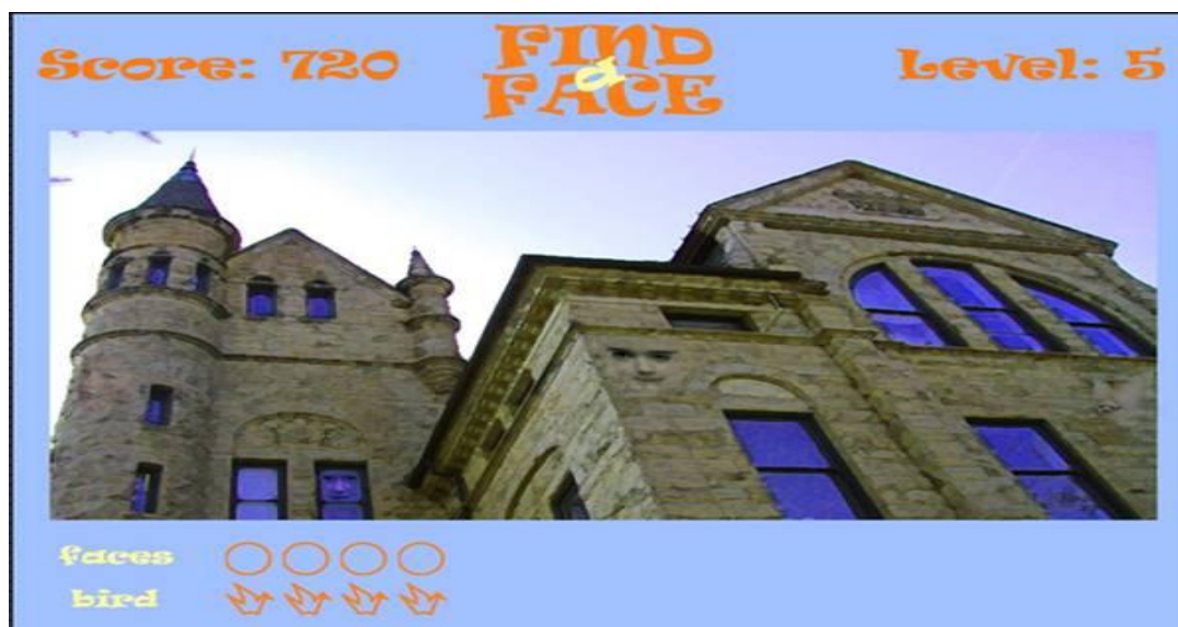
شکل ۱- نمونه‌هایی از آیتیم‌های نرم افزار آموزشی Let's Face It: نمونه آیتیم مربوط به یافتن چهره پنهان

در شکل ۱ دو تصویر از بازی‌های مربوط به نرم افزار