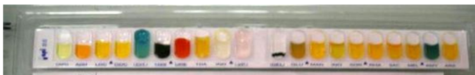
شکل ۱- کیت API-20E سیتروباکتر فروندی

از مردان و (۱/۵۷/۴۸) جدایه از زنان با میانگین سنی بیماران ۲۴ سال به دست آمد.