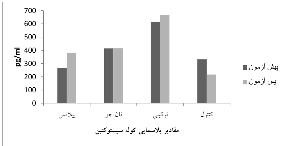
نمودار ۲- میانگین مقادیر پلاسمایی کوله سیستوکینین در چهار گروه مورد مطالعه در پیش آزمون و پس آزمون