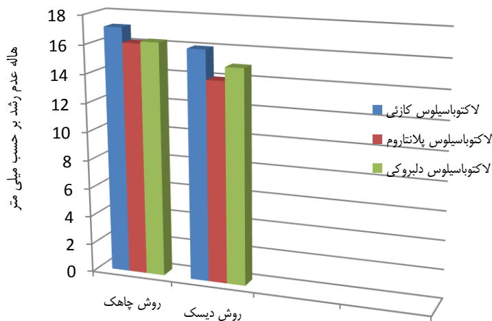
نمودار ۳- مقایسه روش چاهک و دیسک

میلی‌متر در روش دیسک کمترین میزان مهار کنندگی را از خود نشان داد (نمودار ۳).