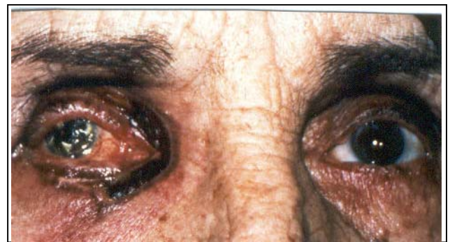
تصویر شماره ۲- کنتراکچر شدید پلک‌ها

شش ماه بعد از عمل دید بیمار در حد درک نور بود، پلک‌ها کنتراکچر کم‌تری داشته و شکاف پلکی در زمان بستن چشم ۳ میلی‌متر بود. قرنیه به شدت اسکولاریزه و کدر مشاهده شد و در معاینه شبکیه عروق به طور قابل توجهی نازک شده بودند.