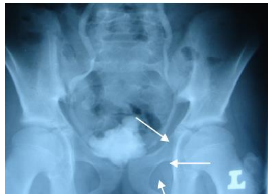
تصویر ۲- نقص پرشدن مربوط به نخ نایلونی در داخل حالب چپ

مادرزادی سیستم ادراری وجود نداشت، در معاینه بالینی بیمار به غیر از حساسیت خفیف در ناحیه لگن یافته غیرطبیعی گزارش نشده است. یافته های آزمایشگاهی به صورت هماچوری میکروسکوپی و تغییرات مربوط به عفونت ادراری بود.