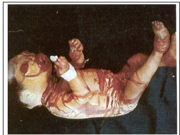
تصویر شماره ۴- نوزاد دختر، لب‌های برگشته، پلک‌های برگشته و انتهای آتروفیک

نوزاد داخل انکوباتور گرم و مرطوب قرار گرفت و شرایط جداسازی و استرلیزاسیون رعایت گردید. برای نوزاد، مایع، اکسیژن و آنتی‌بیوتیک لازم تجویز شد و بیوپسی از پوست نیز صورت گرفت که نتیجه آن هایپرکراتوز شدید بود. روز بعد نوزاد با تابلوی زجر تنفسی فوت کرد.