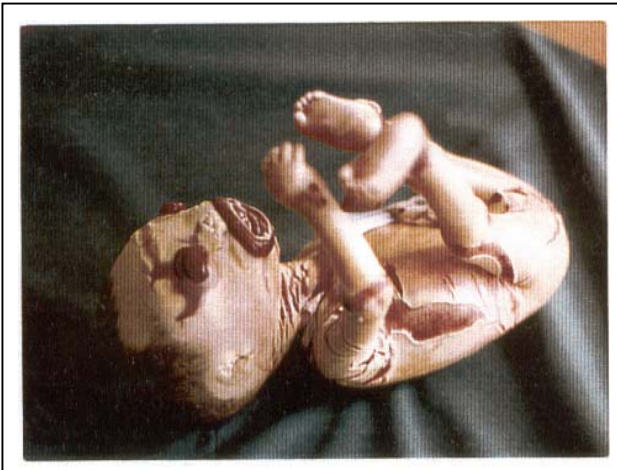
تصویر شماره ۱- نوزاد پسر با شکاف‌های عمیق پوستی