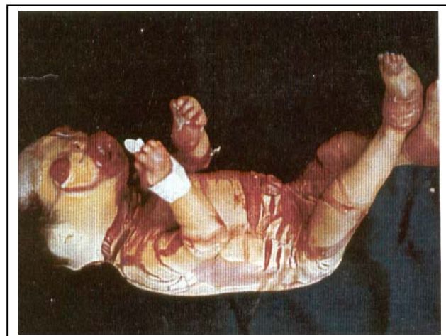
تصویر شماره ۴- نوزاد دختر، لبهای برگشته، پلکهای برگشته و انتهای آتروفیک

نوزاد داخل انکوباتور گرم و مرطوب قرار گرفت و شرایط جداسازی و استرلیزاسیون رعایت گردید. برای نوزاد، مایع، اکسیژن و آنتی بیوتیک لازم تجویز شد و بیوپسی از پوست نیز صورت گرفت که نتیجه آن هایپرکراتوز شدید بود. روز بعد نوزاد با تابلوی زجر تنفسی فوت کرد.