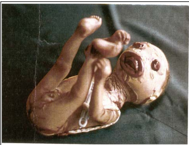
تصویر شماره ۲- نوزاد پسر، لب‌های برگشته، پلک‌های برگشته و اندام‌های دفرمه

متخصص بیماری‌های زنان پی‌گیری و مشاوره قبل از حاملگی بعدی را به والدین توصیه کرده بود اما متأسفانه اقدام خاصی در این زمینه توسط آن‌ها صورت نگرفت و مادر به طور مجدد در تاریخ ۸۰/۱۲/۲۵ با حاملگی ۳۵ هفته و ۱ روز و پارگی کیسه آب و شروع دردهای زایمانی مراجعه کرد. پس از کنترل و انجام شدن کارهای لازم، در نهایت بیمار تحت عمل سزارین قرار گرفت و نوزاد دختر با آپگار ۷ و ۸ و قد ۴۵ سانتی‌متر و وزن ۲۵۰۰ گرم که خصوصیات ظاهری آن به طور کامل مشابه نوزاد قبلی بود متولد گردید و به بخش نوزادان تحویل داده شد (تصویرهای شماره ۲ و ۴).