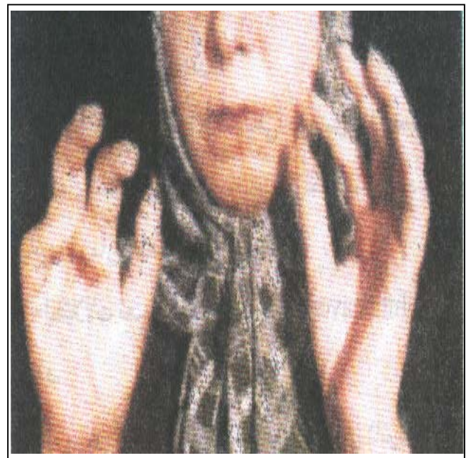
شکل ۱- الف: وضعیت انگشتان بیمار قبل از درمان با آلپروستادیل