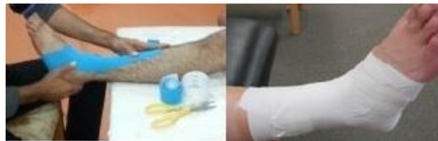
شکل ۱- روش چسباندن تیپ سفید (سمت راست) و تیپ کنزیو (سمت چپ)

بعد از چسباندن تیپ و سپری شدن ۲۰ دقیقه جهت ایجاد اثرات حاصل از تیپ، از آزمودنی‌ها خواسته شد که تا شاخص تعبیه‌شده در 50\% حداکثر پرش عمودی هر یک از آن‌ها پرش نموده و با پای غالب خود فرود تک‌پا انجام داده و با قراردادن دست در ناحیه لگن پایدار شوند و به