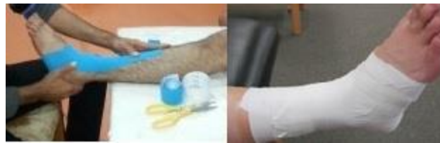
شکل ۱- روش چسباندن تیپ سفید (سمت راست) و تیپ کنزیو (سمت چپ)

بعد از چسباندن تیپ و سپری شدن ۲۰ دقیقه جهت ایجاد اثرات حاصل از تیپ، از آزمودنی‌ها خواسته شد که تا شاخص تعبیه‌شده در 50\% حداکثر پرش عمودی هر یک از آن‌ها پرش نموده و با پای غالب خود فرود تک‌پا انجام داده و با قراردادن دست در ناحیه لگن پایدار شوند و به