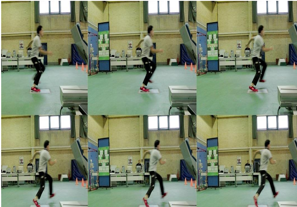
شکل ۱- تصویر انجام مانور برش از نمای اف: قدامی (ساجیتال) ب: طرفی (فرونال)

و میانی سکون کمتر از مردان خم کرده‌اند. زاویه خم شدن تنه در لحظه تماس اولیه برای زنان و در مرحله میانی سکون برای مردان، بیشتر بوده است. مقدار خم شدگی جانبی تنه در مردان بالاتر بوده و در زاویه ولگوس زانو و دامنه حرکتی زانو، زنان مقدار بیشتری را به خود اختصاص داده‌اند.