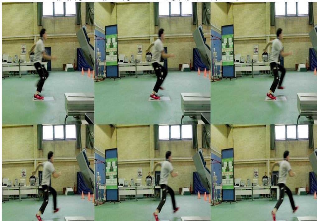
شکل ۱- تصویر انجام مانور برش از نمای اف: قدامی (ساجیتال) ب: طرفی (فرونرال)

و میانی سکون کمتر از مردان خم کرده‌اند. زاویه خم شدن تنه در لحظه تماس اولیه برای زنان و در مرحله میانی سکون برای مردان، بیشتر بوده است. مقدار خم شدگی جانبی تنه در مردان بالاتر بوده و در زاویه ولگوس زانو و دامنه حرکتی زانو، زنان مقدار بیشتری را به خود اختصاص داده‌اند.