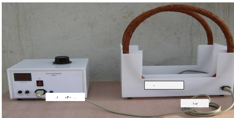
شکل ۱- نمایی از دستگاه الکترومگنت

۱- کلید روشن و خاموش، ۲- ولوم تنظیم فرکانس، ۳- ولوم تنظیم عرض پالس، ۴- ولوم تنظیم دامنه پالس، ۵- نشان‌دهنده دامنه پالس برحسب ولت، ۶- خروجی (جهت اتصال توسط کابل ارتباطی به سیم‌پیچ‌ها)، ۷- اتصال زمین، ۸- فیوز (۱۰ آمپر)، ۹- فیش ورودی برق