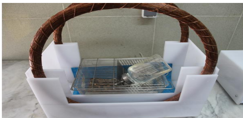
شکل ۲- حیوان در میدان مغناطیسی