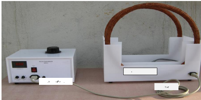
شکل ۱- نمایی از دستگاه الکترومگنت

۱- کلید روشن و خاموش، ۲- ولوم تنظیم فرکانس، ۳- ولوم تنظیم عرض پالس، ۴- ولوم تنظیم دامنه پالس، ۵- نشان‌دهنده دامنه پالس برحسب ولت، ۶- خروجی (جهت اتصال توسط کابل ارتباطی به سیم‌پیچ‌ها)، ۷- اتصال زمین، ۸- فیوز (۱۰ آمپر)، ۹- فیش ورودی برق