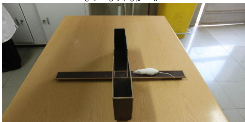
شکل ۳- حیوان مستقر در ماز صلیبی (T-Maze) قبل از تجویز هیستامین