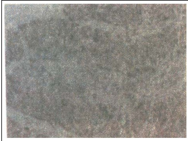
تصویر شماره ۱- نمای میکروسکوپی تومور برنر بدخیم

بررسی میکروسکوپی امنتوم درگیری آنرا با بافت تومورال نشان داد (شکل شماره ۳). سیتولوژی مایع آسیت نیز از نظر بدخیمی مثبت بود.