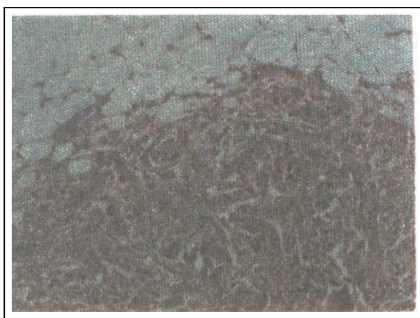
تصویر شماره ۳- درگیری امنتوم در تومور برنر بدخیم

بیمار خانم ۴۸ ساله‌ای است که با سابقه یک ماهه تنگی نفس به بیمارستان مراجعه نمود. در معاینه بیمار توده‌ای با قوام سخت در ناحیه RLQ لمس شد، بیمار دارای آسیت مختصری بود و صداهای تنفسی در قاعده ریه راست کاهش یافته بود. در رادیوگرافی قفسه سینه، افیوژن پلورال وسیع در سمت راست وجود داشت.