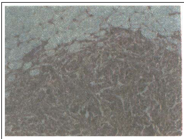
تصویر شماره ۳- درگیری امنتوم در تومور برنر بدخیم