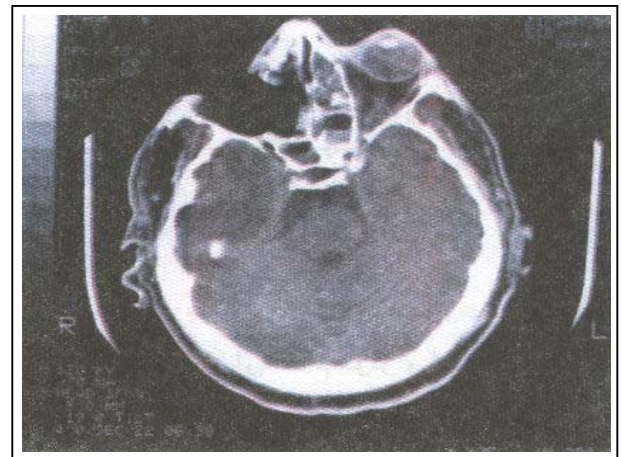
تصویر شماره ۴ - بیمار هفتم. علی‌رغم تخلیه چشم راست، بیماری پیشرفت نمود و درگیری سینوسها و چشم مقابل نیز ایجاد شد.

به اینکه بیمار دچار frozen eye و NLP بود، برای وی exentration اربیت راست و دبریدمان کلیه سینوسها انجام شد و میزان قند خون وی نیز کنترل شد. حال عمومی بیمار بمدت یک هفته مناسب بود ولی بتدریج علائم درگیری چشم مقابل بروز کرد و بعلت عدم رضایت بیمار به exentration تخلیه چشم دوم درگیری مغزی ایجاد شد و در نهایت بیمار فوت کرد.