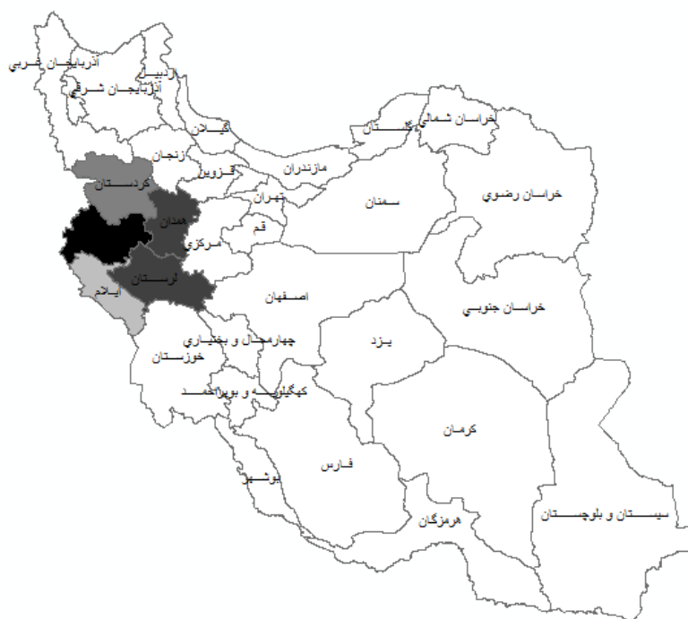
شکل ۲- سهم متناسب به جمعیت فشار خون در اثر چاقی در جنس مذکر در استان های غرب کشور بر حسب درصد

غرب کشور بیان شد و تذکر داده شد که در غرب کشور چاقی از جمله مهم ترین عوامل ایجاد فشار خون می باشد و با توجه به توسعه روز افزون استان های غرب کشور همچون کرمانشاه و همدان این مطالعه متذکر می شود تا در زمینه پیشگیری از شیوع فشارخون و چاقی در این استان ها سیاست های کاربردی توسط وزارت بهداشت، درمان و آموزش پزشکی اتخاذ شود، از جمله مهم ترین محدودیت این مطالعه اطلاعات مربوط به شیوع فشار خون و چاقی از داده های نظام مراقبت بیماری های غیر واگیر در سال ۱۳۸۸ می باشد که در این مطالعه از آن استفاده شده و این داده ها قدیمی بوده و امکان استفاده آن بسیار کم است، گرچه این اطلاعات آخرین اطلاعات وزارت بهداشت درمان و آموزش پزشکی می باشد که به خاطر قابل اطمینان بودن این اطلاعات نویسندگان را ترغیب کرد تا از این اطلاعات هر چند قدیمی استفاده شود.