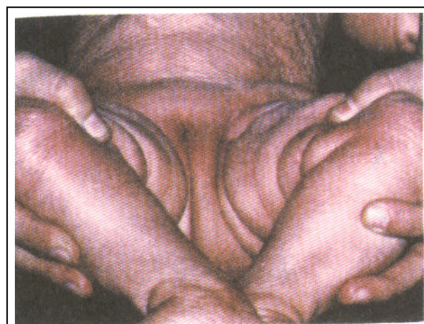
شکل شماره ۴- در این شکل محدودیت شدید حرکتی در معاینه لگن مشاهده می‌شود.

4- Gary L., Darmstadt. The skin in Behrman, klieyman, Jenson edited Nelson Textbook of pediatrics, 16 nd edition Philadelphia-Pennsylvania-W.B Saunders, 2000, PP: 2013.