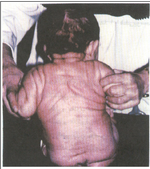
شکل شماره ۲- وجود چین‌های پوستی در قسمت پشت و بازوها قابل مشاهده است.

در شکم فتق نافی واضح و در معاینه اندامها، محدودیت حرکت در مفصل ران به صورت دو طرفه وجود داشت. در معاینه قلب و ریه‌ها نکته غیرطبیعی دیده نشد.