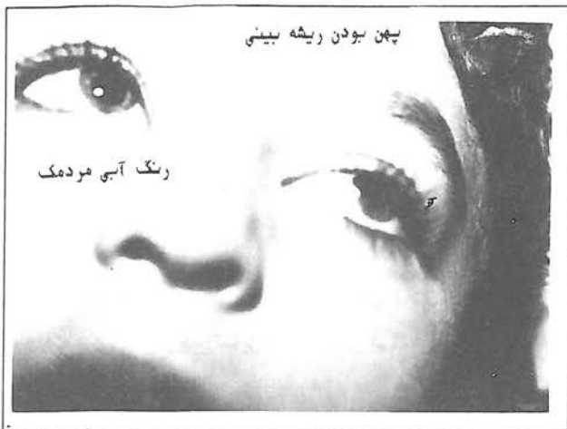
پهن بودن ریشه بینی رنگ آبی مردمک فتوگرافی شماره ۴- رنگ آبی فیروزه‌ای روشن مردمکها و ریشه پهن بینی در بیمار مورد بررسی