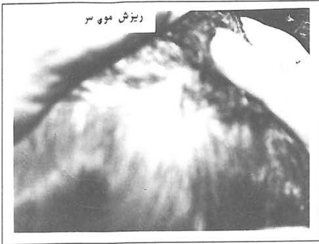
ریزش موی سر

برای بیماری که با کاکل سفید ( white forelock ) مادرزادی