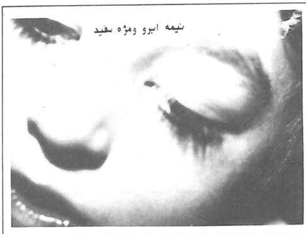
نیمه ابرو و مژه سفید