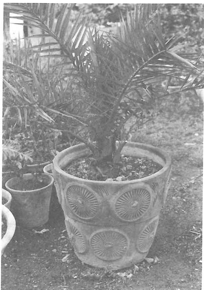
شکل شماره ۴

این بیماری در خانم‌های لاغر و جوان خانه‌دار به دلیل ساختار بدنی و نوع کار در منزل شایعتر می‌باشد که در آنها پرولاپس دریچه میترا ل نیز شیوع بیشتری دارد. بیماران از درد قفسه سینه که نسبتاً شدید و Sharp است شکایت دارند و شدت درد برحسب مقدار و وسعت فشار وارده متغیر بوده ولی بیشتر در قسمت فوقانی قفسه سینه در حوالی مانوبریم استرنوم و مفاصل دنده‌های مجاور می‌باشد. تعداد زیادی از بیماران به علت وجود درد در قفسه سینه چپ و نواحی پره کوردیوم با اضطراب سریعاً به پزشک مراجعه می‌کنند. عوامل تشدید کننده درد در این بیماران شامل تغییر وضعیت از خوابیده به نشسته یا بالعکس و از پهلو به پهلو شدن، خم شدن، سرفه، عطسه، تنفس عمیق یا بلند کردن اشیاء سنگین از زمین است.