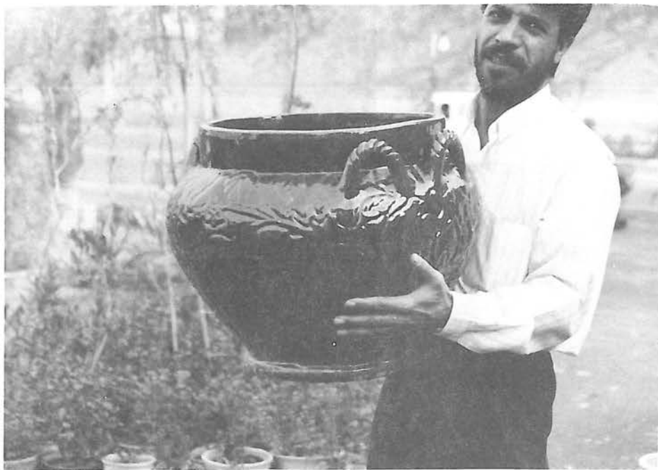
شکل شماره ۳