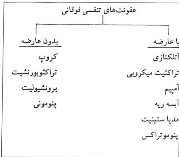
جدول شماره ۱ - طبقه بندی عقونتهای حاد تنفسی فوقانی و تحتانی

عقونتهای تنفسی حاد شایع ترین گرفتاری بشر بوده (۲) و شیوع بیشتر آنها در کودکان بر اهمیت این گروه از بیماری ها در نزد متخصصین اطفال می افزاید. به علت کمبود امکانات آزمایشگاهی قطعی برای شناخت عامل عقونت تنفسی حاد داشتن روشها و دانستن راههای کمکی دیگر برای