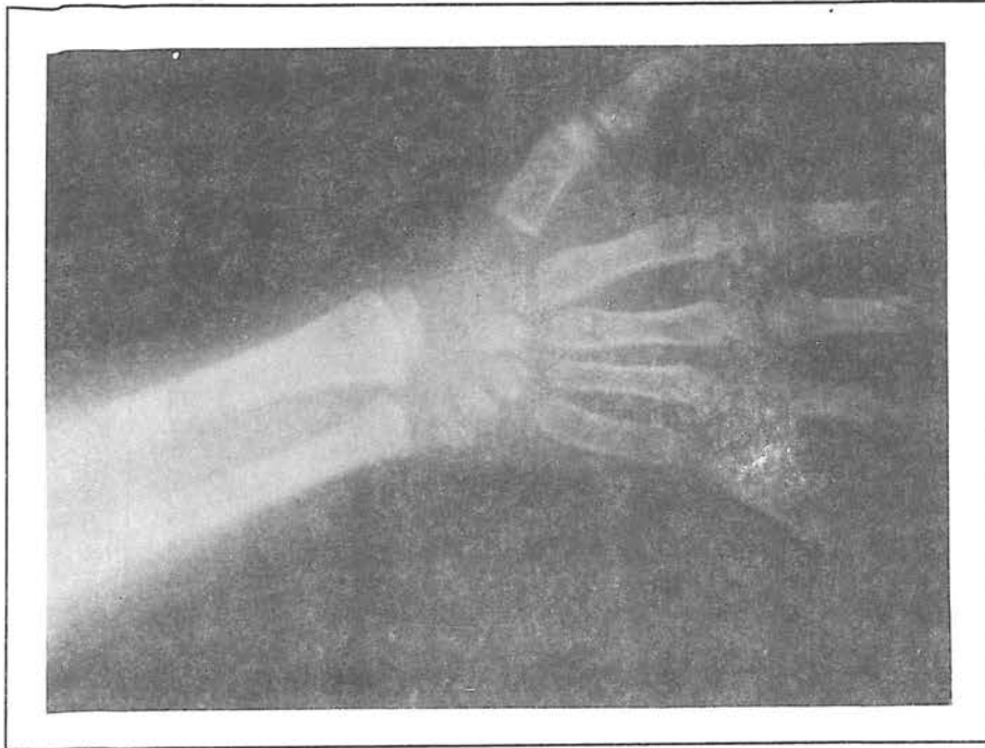
تصویر شماره ۳- رادیوگرافی مچ دست (سن استخوانی حدود ۳ سال است)

۵۰ درصد از بیماران طول قد کمتر از ۳ درصد منحنی رشد و ۴۳ درصد وزن کمتر از ۳ درصد منحنی رشد داشتند و متوسط دور سر بیماران روی منحنی ۵۰ درصد بود. تأخیر تکامل عقلانی شایع بود. دید غیرطبیعی در ۹۴ درصد و شنوایی مختل در ۴۰ درصد بیماران وجود داشت. سایر یافته‌ها عبارت‌است از بیضه نزول نکرده (۷۷ درصد)، هیپوتواسپلنومگالی (۵۰ درصد) و خونریزی غیرطبیعی (۵۶ درصد). اختلالات بینایی و شنوایی و انعقادی و بزرگی احشاء در مطالعات دیگری نیز مشاهده گردید. در یک مطالعه توسط Lee بر روی ۵۸ بیمار با سندرم نونان اختلالات بینایی متعددی در بیماران یافت شد که عبارت بودند از: استرابیسم ۴۸ درصد، عیوب انکساری ۶۱ درصد، آمبلیوپیا ۳۳ درصد، نیستاگموس ۹ درصد و ۶۳ درصد بیماران تغییرات پاتولوژیک در سگمان قدامی چشم داشتند و فقط ۳ درصد از آنها هیچگونه مشکل بینایی نداشتند و به این ترتیب توصیه شده بود که همه افراد مبتلا به سندرم در مراحل اول تشخیص توسط افتالمولوژیست معاینه شوند (۷) . در یک گزارش توسط Sharland ۴۷ نفر از ۷۲ بیمار مورد مطالعه (۶۵ درصد) دارای سابقه خونریزی غیرطبیعی بودند. ۲۹ نفر (۴۰ درصد) PTT