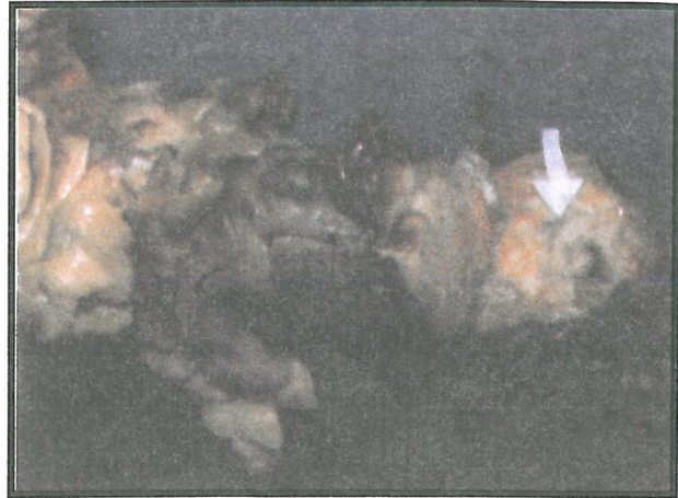
تصویر شماره ۱- نمای ماکروسکوپی کولون بیمار، پیکان سفید نمایانگر محل تومور می باشد