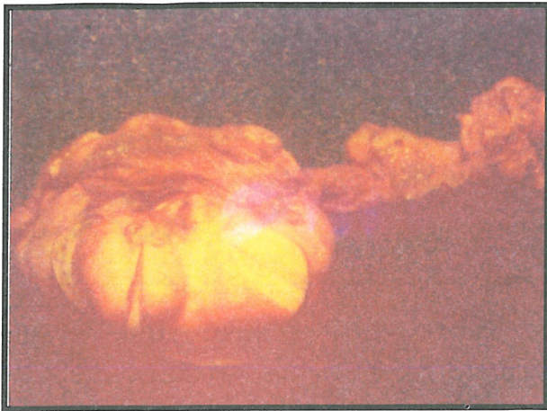
تصویر شماره ۲- نمای ماکروسکوپی تخمدان راست بیمار، سطح مقطع تومور برنر مشهود است.

لوله فالوپ چپ بطول ۵ سانتی متر و دارای یک کیست پاراتوبال بود. تخمدان راست به ابعاد ۴×۳×۲ سانتی متر سطحی نامنظم و قوامی سفت داشت و به رنگ کرم مایل به سفید بود. این تخمدان در برش، سطح مقطعی سفید رنگ و همگن داشت. لوله فالوپ راست بطول ۷ سانتی متر و ظاهری طبیعی مشاهده گردید (تصاویر شماره ۲ و ۳).