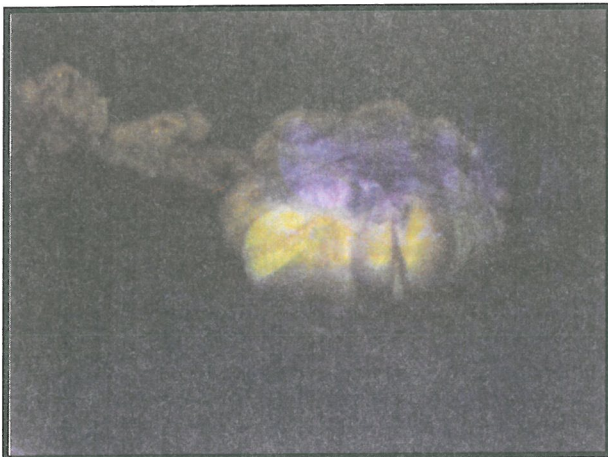
تصویر شماره ۳- نمای ماکروسکوپی تخمدان چپ بیمار، سطح مقطع تومور برنر مشهود است.

یافته های میکروسکوپی - مقاطع تهیه شده از نمونه بیوپسی کولون، تهاجم سلولهای نئوپلاستیک بزرگ و پلی مورف به مخاط کولون را نشان دادند. این سلولها هسته هایی هیپرکروم و سیتوپلاسمی روشن داشتند و در برخی از نقاط، ساختمانهایی شبه غددی تشکیل داده بودند. یافته های فوق مشخصه آدنوکارسینوم کولون با تمایز اندک بود و با بررسی مقاطع تهیه شده از قسمتهای خارج شده کولون، مورد تایید قرار گرفتند درگیری کولون شامل تمامی لایه های آن بود و در غدد لنفاوی ناحیه ای نیز، متاستاز مشاهده شد (تصویر شماره ۴).