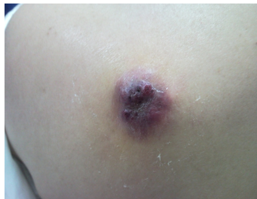
شکل شماره ۲- ضایعه برجسته قرمز ملتهب با سطح زخمی ۲ \times ۲ سانتی متر در قسمت فوقانی سمت راست کمر