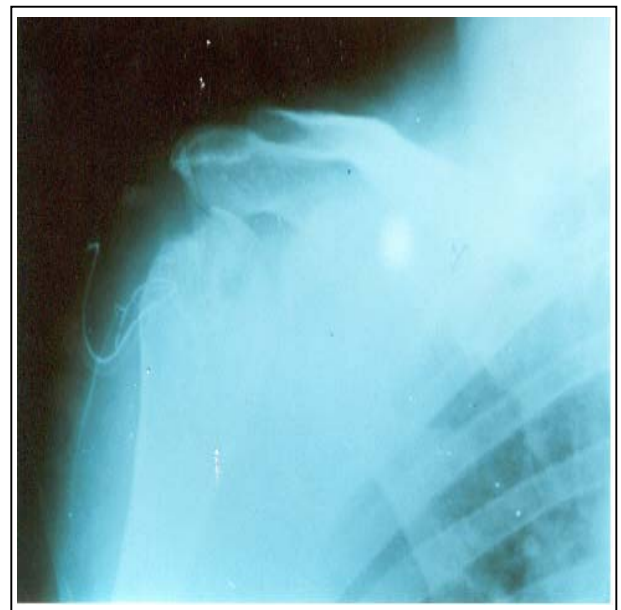
تصویر شماره ۱- رادیوگرافی شانه ضایعات وسیع تخریبی و استئوپوروزیس در سر استخوان بازو (مورد اول)

PPD+=۱۹ میلی‌متر وجود داشت و سایر آزمایش‌ها طبیعی بودند.