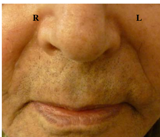
الف. قبل از تزریق

قبل و پس از تزریق و همچنین در پیگیری ۶ ماه بعد از مداخله در شکل شماره ۱ نشان داده شده است.