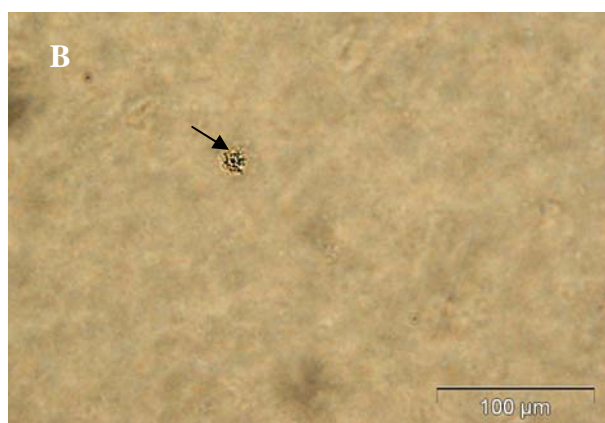
شکل شماره ۲- کلنی‌های اوره آپلازما اوره آلیتیکوم بر سطح محیط کشت اوره آگار که از مایع منی جدا شده اند و در زیر میکروسکوپ فازکنتراست دیده می‌شوند. کلنی‌ها با نوک پیکان مشخص شده اند. (B: ۴۰۰X, A: ۲۰۰X)