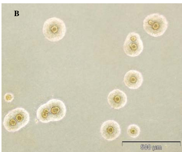
شکل شماره ۱- کلنی‌های مایکوپلازما هومینیس بر سطح محیط کشت آرژینین آگار که از مایع منی جدا شده‌اند و در زیر میکروسکوپ فازکنتراست دیده می‌شوند. (A: 40\times , B: 100\times )

محیط کشت از نارنجی، به صورتی پررنگ مایل به ارغوانی تغییر می‌یابد. به محض مشاهده تغییر رنگ در محیطهای broth، چند قطره از این محیطها بر سطح محیطهای آگار اختصاصی کشت داده شد. محیطهای Arginine/Urea PPLO agar به این ترتیب ساخته شدند: ابتدا ۳۵ گرم از پودر PPLO agar مربوط به شرکت Difco (Difco™ PPLO Agar)، در ۱ لیتر آب مقطر حل گردید و سپس به ازای هر ۷۰ میلی لیتر از این محیط، این مواد اضافه شد: ۱۰ میلی لیتر عصاره مخمر ۱۰٪، ۲۰ میلی لیتر سرم اسب استریل، ۱ میلی لیتر پنی سیلین G (۵۰۰۰۰ U) و ۱۰ میلی لیتر آرژینین یا اوره ۱۰٪ که بجز عصاره مخمر، بقیه مواد فوق پس از اتوکلاو نمودن محیط کشت و رسیدن دمای آن به 40-45^{\circ} در شرایط استریل در زیر هود بیولوژیک به محیط افزوده شدند. pH نهایی برای محیط آگار آرژینین دار بر روی ۷ و برای محیط آگار اوره دار روی ۶-۶/۵ تنظیم گردید و سپس در داخل پلیت‌های استریل ریخته شد.