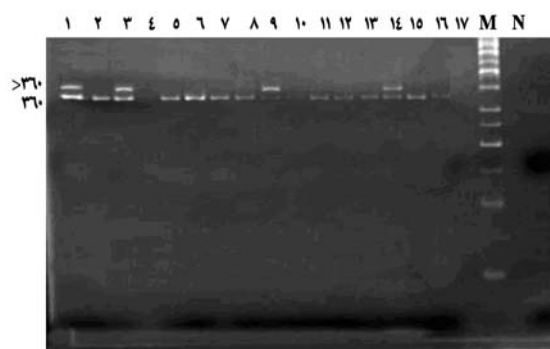
شکل شماره ۱- جهش ITD در ژن FLT3 در زیرگروه‌های مختلف بیماران AML M = Marker N = Negative control

از ۱۰۱ بیمار مبتلا به AML مورد بررسی در این مطالعه با زیرگروه‌های مختلف FAB (به جزء M6 و M7) ۱۸٪ تضاعف توالی داخلی (ITD) را داشتند، که ۱۶٪ آن‌ها زیرگروه M3 بودند. در شکل شماره ۱ تعدادی از این افراد دیده می‌شوند که در مورد آن‌ها بعد از هر شکل توضیح داده شده است.