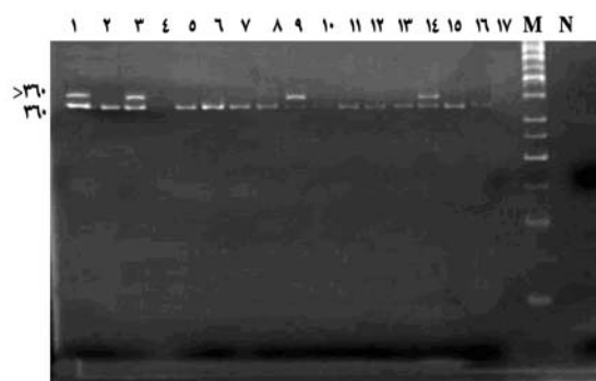
شکل شماره ۱- جهش ITD در ژن FLT3 در زیرگروه‌های مختلف بیماران AML M = Marker N = Negative control

از ۱۰۱ بیمار مبتلا به AML مورد بررسی در این مطالعه با زیرگروه‌های مختلف FAB (به جزء M6 و M7) ۱۸٪ تضاعف توالی داخلی (ITD) را داشتند، که ۱۶٪ آن‌ها زیرگروه M3 بودند. در شکل شماره ۱ تعدادی از این افراد دیده می‌شوند که در مورد آن‌ها بعد از هر شکل توضیح داده شده است.