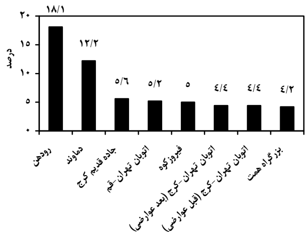
نمودار شماره ۱- شایع‌ترین مناطق وقوع حادثه

در سال ۱۳۸۲ سرویس امداد هوایی با انجام ۲۴۴ مأموریت، در مجموع تعداد ۵۱۸ مصدوم را به بیمارستان امام خمینی منتقل کرده است. تعداد مصدومان انتقال یافته در هر مأموریت بطور متوسط ۲/۱ بیمار بود. این مأموریت‌ها در ۵۰ محدوده مکانی انجام شده بودند که ۱۸ منطقه، در داخل شهر تهران و ۳۲ منطقه، خارج از شهر تهران قرار داشت (نمودار شماره ۱).