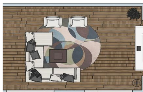
شکل ۱- پلان فضای نشیمن

در این بخش از تحقیق به بررسی الگوهای معماری بیوفیلیک در مجتمع مسکونی جهت افزایش سلامت روان و جسم پرداخته است. اولین و مهمترین بخش مسکن، فضای نشیمن است. برای شروع فرآیند شبیه سازی برای فضای نشیمن ابعاد و اندازه ۸ متر در طول و ۶ متر در عرض (۴۸ متر مربع) در نظر گرفته شده است. در شبیه‌سازی اجزای اصلی فضا (کف، سقف، دیوارها) از مصالح پر استفاده (گچ برای دیوارها و چوب (پارکت) برای کف) استفاده شده است (شکل ۱).