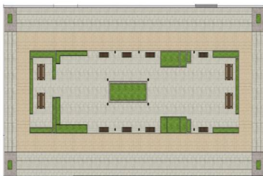
شکل ۵- پلان فضای باز