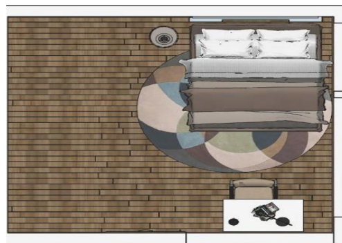
شکل ۲- پلان فضای اتاق خواب

بعد از فضای نشیمن، اتاق خواب یکی دیگر از فضاهای مهم محیط مسکونی می‌باشد که دارای کارکردها و استفاده‌های متعدد از قبیل محیط استراحت و فضای کاری می‌باشد. برای شروع فرآیند شبیه‌سازی فضای اتاق خواب ابعاد و اندازه ۴ متر در طول و ۴ متر در عرض (۱۶ متر مربع) در نظر گرفته شده است (شکل ۲).