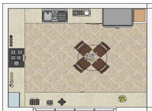
شکل ۳- پلان فضای آشپزخانه

فضای شبیه‌سازی شده‌ی آشپزخانه با ابعاد و اندازه ۵ متر طول و ۴ متر عرض (۲۰ متر مربع) در نظر گرفته شده است (شکل ۳).