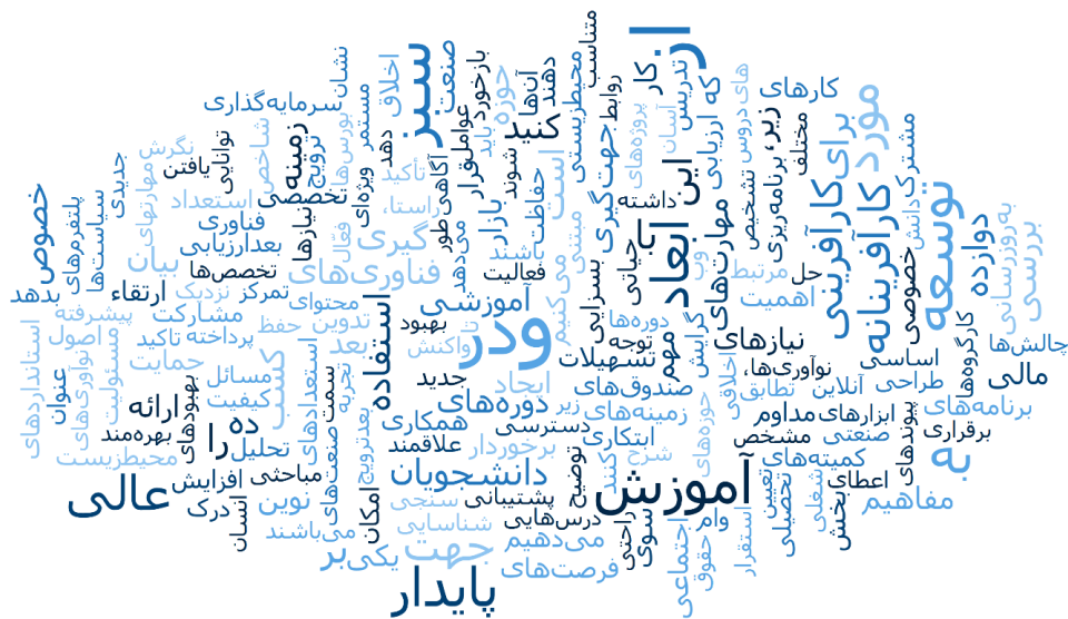
نمودار ۳- کلمات و گزاره‌های بکار گرفته شده توسط خبرگان در زمان مصاحبه

نتایج تحلیل عاملی تاییدی مندرج در جدول ۲ نشان