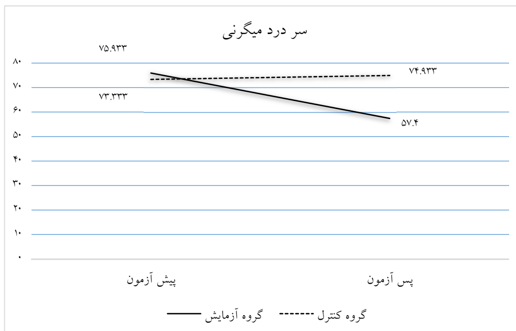
شکل ۲- مقایسه میانگین نمرات درد میگرنی در دو گروه در مراحل پیش‌آزمون و پس‌آزمون

مبتلا به سردرد میگرن بود. براساس نتایج بین پس‌آزمون آزمودنی‌های گروه کنترل و گروه آزمایش از لحاظ نمره تحریفات شناختی با کنترل پیش‌آزمون تفاوت معنادار وجود دارد. به عبارتی روان‌پویشی کوتاه مدت فشرده بر کاهش تحریفات شناختی بیماران مبتلا به سردرد میگرن مؤثر است. با توجه به مباحث فوق و پژوهش‌ها صورت گرفته در این زمینه همچون رفیع پور و همکاران (۱۴۰۱) کالدیرولی و همکاران (۲۰۲۰) می‌توان بیان نمود در درمان روان‌پویشی فشرده و کوتاه‌مدت، بیماران سردرد میگرنی ممکن است افکار خود را بیان کنند و نیازهای خود را بهتر به دیگران توضیح دهند، زیرا در جلسات روان‌درمانی به صورت دقیق، کوتاه مدت و پویا