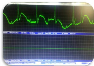
شکل ۲- الکتروکاردیوگرام موش صحرایی با انفارکتوس میوکارد