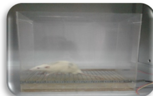
شکل ۳- فوت شوک تحریک الکتریکی