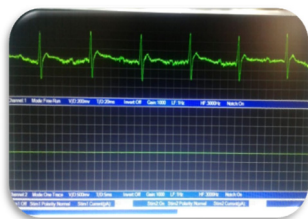
شکل ۱- الکتروکاردیوگرام موش صحرایی سالم