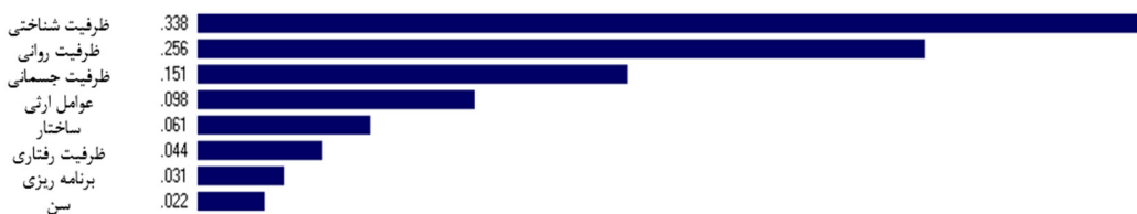
شکل ۳- تحلیل سلسله مراتبی مولفه های زمینه‌ای توسعه سواد بدنی دانش آموزان

دانشمندان و ذهنیت های خلاق جوان، دیدگاه جهانی، پایگاه وسیعی از دانش و آخرین تفکر در موضوعاتی مانند روابط اجتماعی، ارتباطات، هدایت مریبان، انسجام تیم، انگیزه و جو انگیزشی، تأثیرات مخاطب و اخلاق تشکیل شده است (۲۵). در این پژوهش اجتماعی شدن به عنوان یکی از شاخص های ظرفیت روانی در نظر گرفته شده است. دانش آموزان با اجتماعی شدن، بیشتر انگیزه پیدا می کنند تا توانایی های خود را پیدا کنند و در اینجاست که نیاز به سواد بدنی ضرورت می یابد. ظرفیت جسمانی یکی از دیگر فاکتورهای مهم در عوامل زمینه‌ای توسعه سواد بدنی است (۱۵). هر سه مورد اول تا سوم یعنی ظرفیت شناختی، ظرفیت روانی و ظرفیت جسمانی در واقع اهداف تربیت بدنی هستند. با رویکرد توسعه‌ای به این مولفه‌ها می توان شاهد رشد سواد بدنی در بین دانش آموزان باشیم. یکی دیگر از مولفه‌ها، مولفه‌ی شاخص ارثی بود که نتیجه آزمون تی مستقل نشان داد بین استان‌های برخوردار و کم برخوردار تفاوت