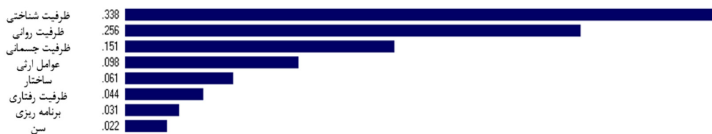
شکل ۳- تحلیل سلسله مراتبی مولفه های زمینه‌ای توسعه سواد بدنی دانش آموزان

دانشمندان و ذهنیت های خلاق جوان، دیدگاه جهانی، پایگاه وسیعی از دانش و آخرین تفکر در موضوعاتی مانند روابط اجتماعی، ارتباطات، هدایت مریبان، انسجام تیم، انگیزه و جو انگیزشی، تأثیرات مخاطب و اخلاق تشکیل شده است (۲۵). در این پژوهش اجتماعی شدن به عنوان یکی از شاخص های ظرفیت روانی در نظر گرفته شده است. دانش آموزان با اجتماعی شدن، بیشتر انگیزه پیدا می کنند تا توانایی های خود را پیدا کنند و در اینجاست که نیاز به سواد بدنی ضرورت می یابد. ظرفیت جسمانی یکی از دیگر فاکتورهای مهم در عوامل زمینه ای توسعه سواد بدنی است (۱۵). هر سه مورد اول تا سوم یعنی ظرفیت شناختی، ظرفیت روانی و ظرفیت جسمانی در واقع اهداف تربیت بدنی هستند. با رویکرد توسعه ای به این مولفه ها می توان شاهد رشد سواد بدنی در بین دانش آموزان باشیم. یکی دیگر از مولفه ها، مولفه ای شاخص ارثی بود که نتیجه آزمون تی مستقل نشان داد بین استان های برخوردار و کم برخوردار تفاوت